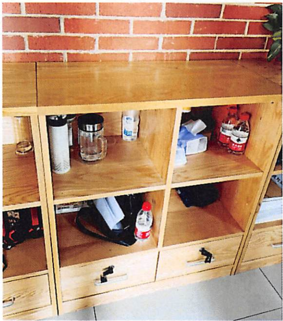
序号 22 矮柜 ↑