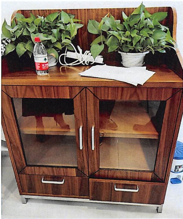
序号 38 茶水柜 ↑