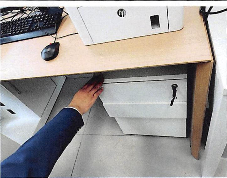
序号 10 办公桌 ↑