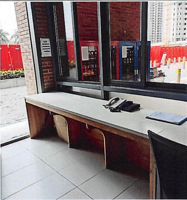
序号 21 办公桌 ↑