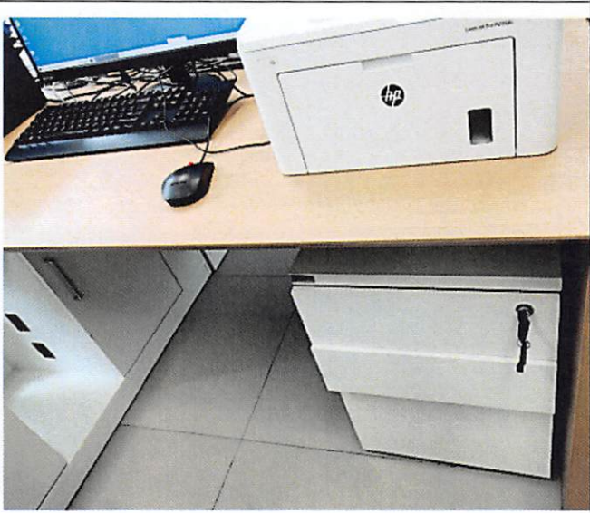
序号 14 诊断桌 ↑