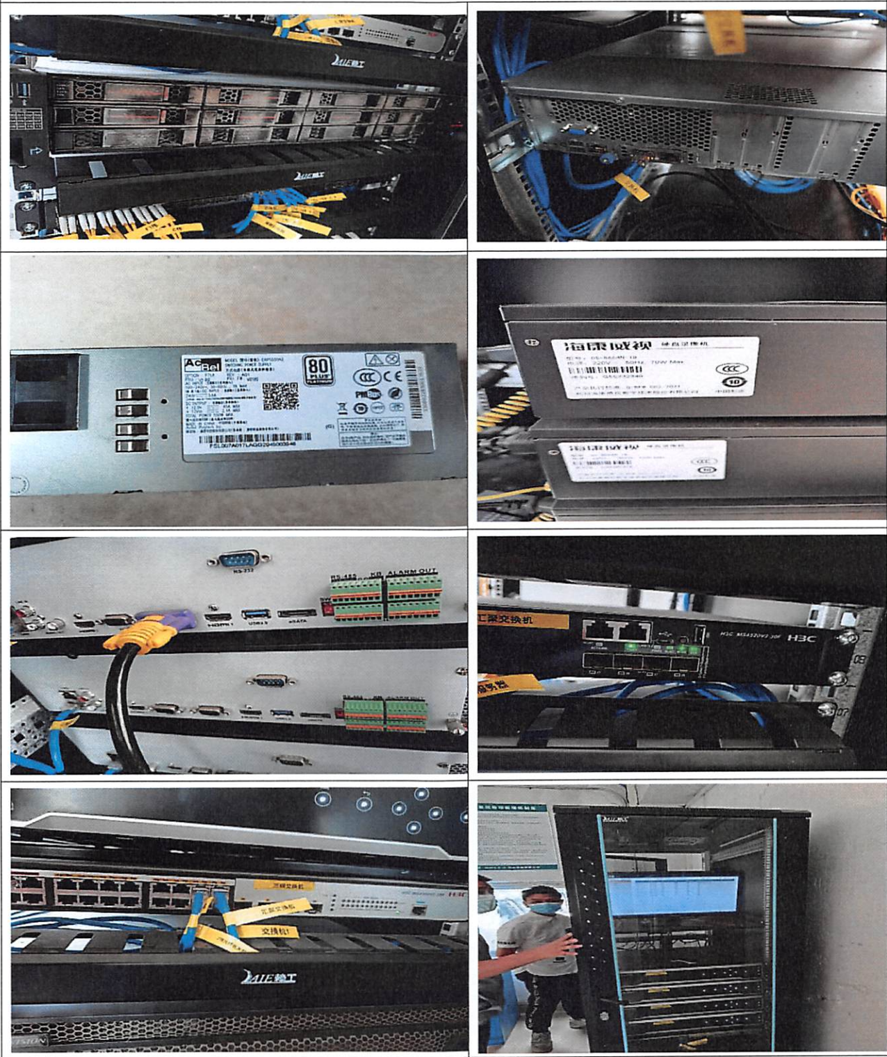
现场检查及现场资料审核照片