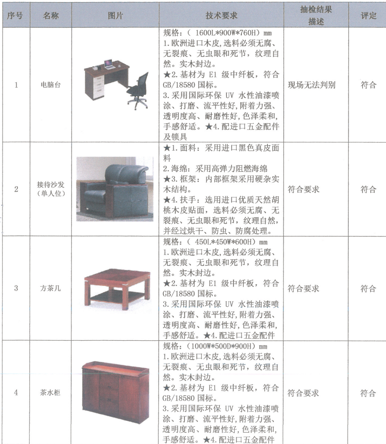
附表三: 招投标技术规格要求