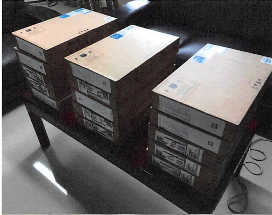
现场抽检 15 台笔记本电脑