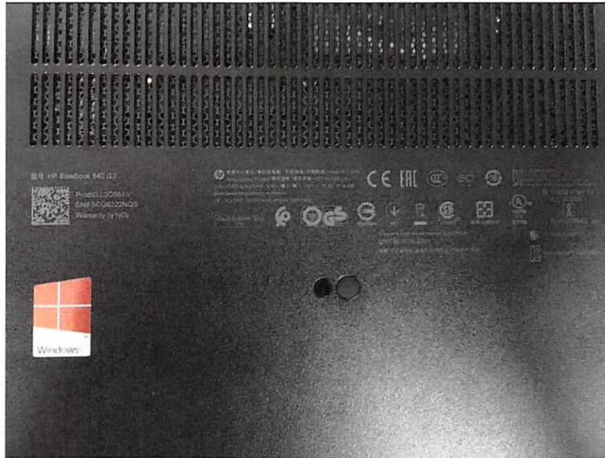
笔记本电脑二背面