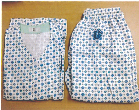
病人服(长袖上衣、裤子):