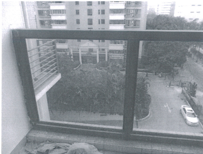
附图 2 301 房型后阳台护栏