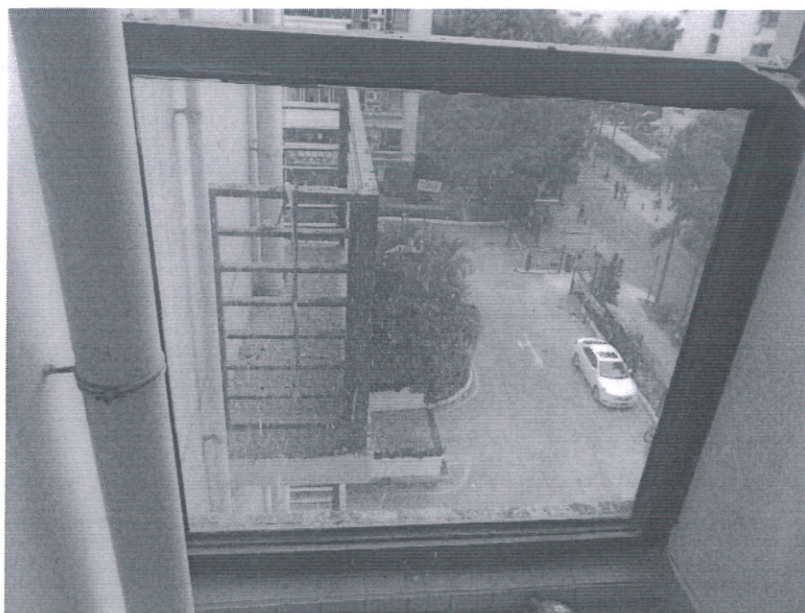
附图 4 302 房型后阳台护栏