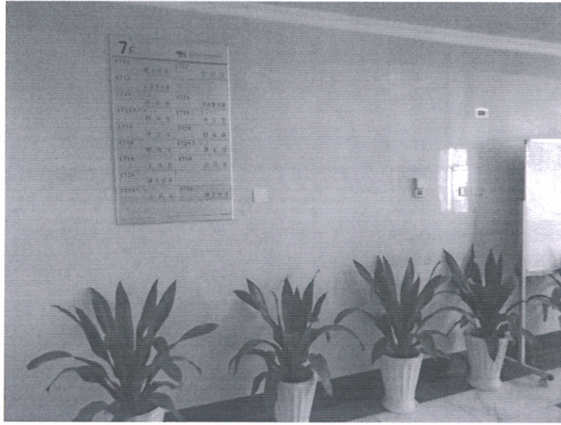
附图 5 福保办公室电梯厅