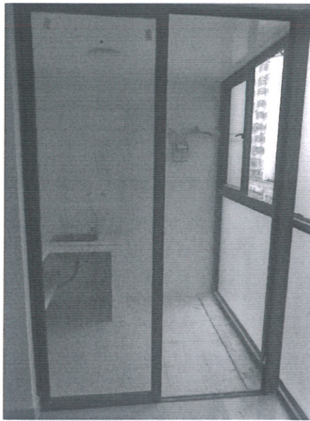
附图 1 301 房型厨房门