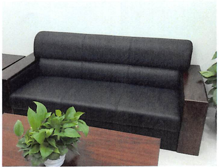
图二（沙发非不锈钢脚架）